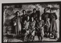
Laboratori di Sacco Manifattura Tabacchi

Macere traccianti tabacchine. Ippocrasiani, Accattasari